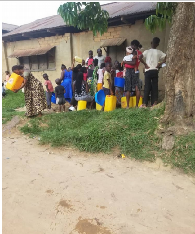
Kranaro Camp Plessy, Kalima